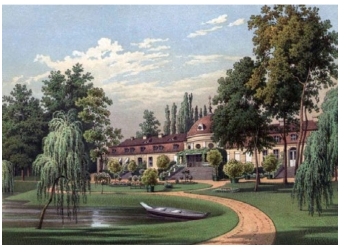
Ryc. 6. Kubły ustawione na podjeździe przed pałacem Glisno powiat sulęciński [Anonim, zbiór litografii 1857–1883]

Fig. 5. Containers in the driveway in front of the palace in Wiejkowo commune Kamień [Anonymous, a collection of lithographs 1857–1883]