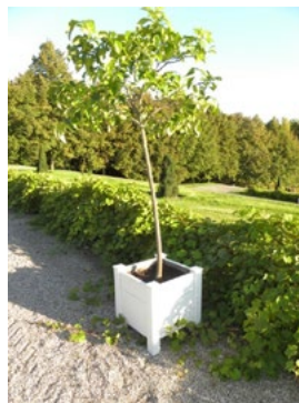
Fig. 5. Lemon tree in a container of Versailles in Sanssouci (Germany), 2012

Fragmety kamiennych lub ceramicznych donic należą do interesujących znalezisk archeologicznych podczas prowadzonych prac wykopaliskowych. Pojemniki dekoracyjne są źródłem cennych informacji, przydatnych w ustalaniu rodzaju uprawianych dawniej roślin oraz ułatwiających odtwarzanie układu kompozycyjnego ogrodu. Przeprowadzona analiza fragmentów donic z prac wykopaliskowych w Wilanowie wykazała, w przypadku donic