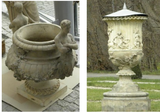
Ryc. 6. Waza (1858) podczas renowacji; Ryc. 7. Waza ogrodowa na parterze Ogrodu Włoskiego; Zespół pałacowy w Wilanowie, 2011 r.

o formie zbliżonej do misy sadzono w nich prawdopodobnie drzewka cytrusowe. W ogrodzie wilanowskim natrafiono także na liczne fragmenty donic, które wkopywano w ziemię aż po górną krawędź wylewu, a sadzono w nich rośliny cebulowe, bulwiaste lub o korzeniach palowych. Wkopywanie doniczek w podłoże miało zastosowania praktyczne, do których należały: oszczędność wody do podlewania, zabezpieczenie przed gryzoniami oraz łatwość wyjmowania roślin z donic na okres zimowania. W trakcie wykopalisk natrafiano również na inne wyroby ceramiczne, takie jak fragmenty ceramicznych kloszy służących do nakrywania na noc szczególnie cennych roślin, co chroniło np. szparagi, seler naciowy czy cykorię przed niskimi temperaturami i zwierzętami [Morysiński 2006]. Ryciny 6 i 7 przedstawiają bogato zdobione pojemniki na rośliny w parku w Wilanowie.