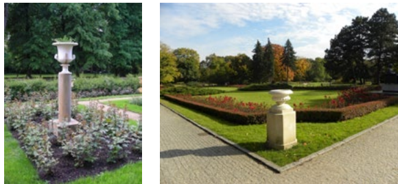
Ryc. 8. Waza na postumencie, na kwietniku z róż, Łańcut, 2011 r.

Jak wynika z analizy zebranych materiałów ikonograficznych i przeprowadzonych badań terenowych pojemniki parkowe służące do ekspozycji roślin przyjmowały kształty: donic (szerokość pojemnika zbliżona do jego wysokości; donice ustawiano bezpośrednio na ziemi lub niewielkiej bazie), mis (szerokie naczynia), urn ogrodzeniowych (ustawiane w układzie rytmicznym na szczycie ogrodzenia), amfor (wysokie, smukłe naczynie z dwoma umieszczonymi symetrycznie po bokach uchwytami), waz, kwietników (na kilka okazów roślin), skrzyń (kubłach) o podstawie koła lub kwadratu z opaskami stalowymi oraz pojemników wersalskich. Często dla celów estetycznych misy, wazy, amfory i urny ustawiano na postumentach (Fig. 8, 9).