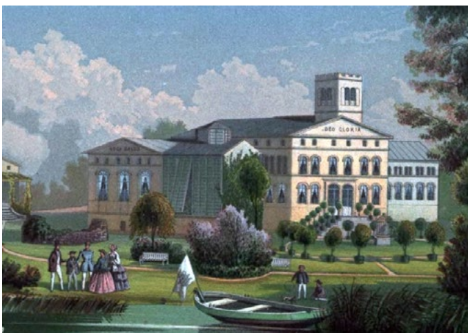
Ryc. 5. Kubły ustawione na podjeździe przed pałacem Wiejkowo powiat kamiński [Anonim, zbiór litografii 1857–1883]

Przy czym szczególnie interesującą pozycją w przeprowadzonych badaniach ikonograficznych było 16 tomów z 960 litografiami i tekstami opisów rezydencji w Prusach pochodzących z lat 1857–1883.