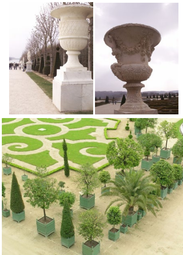
Ryc. 1, 2. Wazy w alejach Wersalu, 2012 r.; Ryc. 3. Pojemniki w formie skrzyni na Parterze Oranżeriowym; Wersal (Francja), 2011 r. Fig. 1, 2. Vases in the alleys of Versailles, 2012; Fig. 3. Containers in form of a box on Parterre de l'Orangerie; Versailles (France), 2011

Na terenie Polski szczególnego znaczenia nabrało dążenie do okazałości i sarmackiego przepychu. Ogrody królewskie i magnackie – zamkowe i pałacowe obejmowały odpowiednio pałac lub zamek, ukształtowany przestrzennie wraz z otaczającym dziedzińcem i ogrodem. Poszczególne elementy połączone osią kompozycyjną to: dojazd i brama wjazdowa, dziedzińiec, budynek mieszkalny oraz ogród tarasowy lub płaski. Kwatery były stosunkowo niewielkie, podzielone na regularne kwadraty. W klimacie Polski pojemniki z roślinami były na zimę przenoszone do pomieszczeń, a w lecie wystawiane do parku. Eksponowano je w sąsiedztwie rezydencji lub oranżerii.