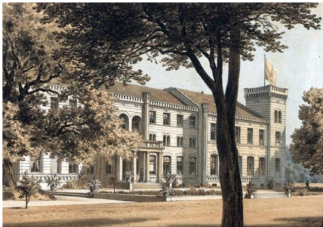
Ryc. 7. Agawy w donicach wokół pałacu w Potulicach powiat nakielski [Anonim, zbiór litografii 1857–1883]