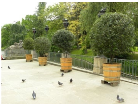
Ryc. 4. Formowane drzewa laurowe w kubłach na tarasie przy Pałacu Łazienkowskim, Warszawa; Ryc. 5. Drzewko cytryny w pojemniku typu wersalskiego w Sanssouci (Niemcy); 2012 r.

Sprowadzane krzewy ozdobne (np. azalie), drzewka cytrusowe, palmy, agawy czy juki, charakteryzowały się dużymi wymaganiami cieplnymi. Uprawiano je w oranżeriach lub wnętrzach pojemnikach, a latem wystawiano na tarasy, partery kwiatowe i gazonowe [Pudelska i Rudnicka 2010]. Do dużych roślin używano kubłów drewnianych – dębowych lub sosnowych [Jankowski 1900]. Kubły wykonywano z klepek, pojemnik był wewnątrz wypalony, a na dnie osmołowany i przedziurawiony, obity żelaznymi obręczami, z dwoma uchwytnymi do przenoszenia (Ryc. 4) [Jankowski 1880]. Kułby wykonywano w kształcie okrągłym albo „graniaste na nóżkach stojące” czyli sześciennie, tzw. pojemniki wersalskie (Ryc. 5) [Wodzicki 1820].