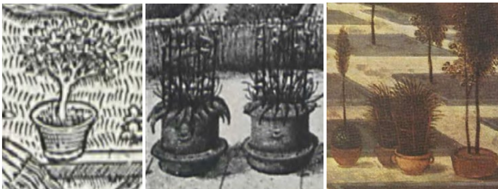
Ryc. 2. Fragment ryciny „Ogród miłości”; ryc. 3. Fragment ryciny z Brewiarza Grimani [Gothein 1914]; ryc. 4. Fragment obrazu „ Wiosna ” Abel Grimmer 1607 r.

Mała architektura ogrodowa występująca w ogrodach średniowiecznych miała przede wszystkim znaczenie użytkowe. Jak ukazuje ikonografia donice ceramiczne służyły do uprawy roślin kwiatowych i ziół. N rycinie z XV w. widoczne są; łąka pod murami miasta, przepływający strumyk, żywopłoty pełniące funkcję ogrodzenia, sześciokątny stół oraz roślina w prostej donicy (Ryc. 2). Na jednej z kart z Brewiarza Grimani również znajduje się rysunek dwóch donic, wykonanych prawdopodobnie z gliny, z podstawkami i uszkami do przenoszenia (Ryc. 3). Obraz Wiosna [1607] przedstawia ludzi pracujących w ogrodzie, a na ścieżce pomiędzy kwaterami stoją gliniane donice z roślinami.