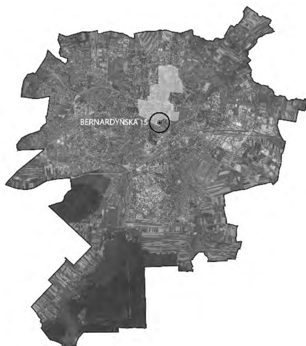
Ryc. 1. Lokalizacja terenu opracowania względem miasta Lublin.

Przedmiotem pracy dyplomowej był projekt architektoniczno-budowlany obiektów odpowiadających na potrzeby funkcjonalne wydarzenia artystycznego o nazwie reART – Lubelskie Biennale Sztuki.