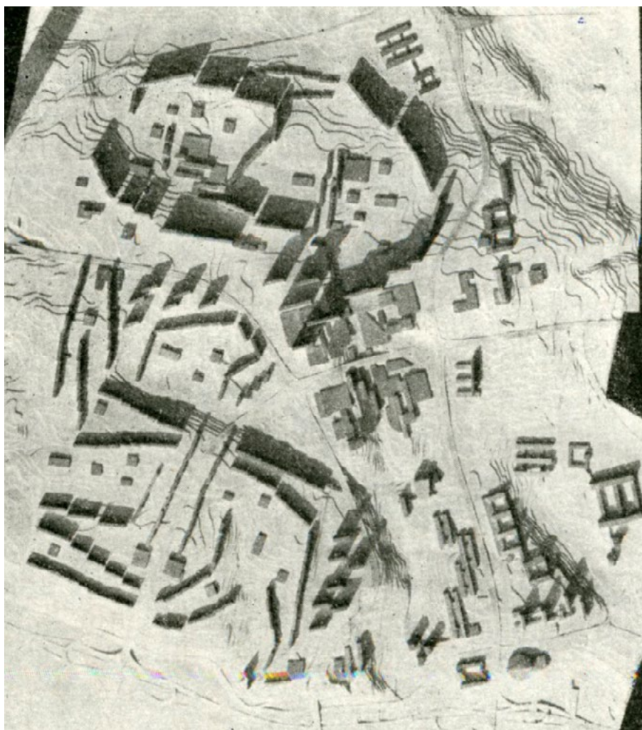
Ryc. 8. Wyróżnienie I – model konkursowy. Rep. Za: Architektura, 10 (287)/1971, s. 380