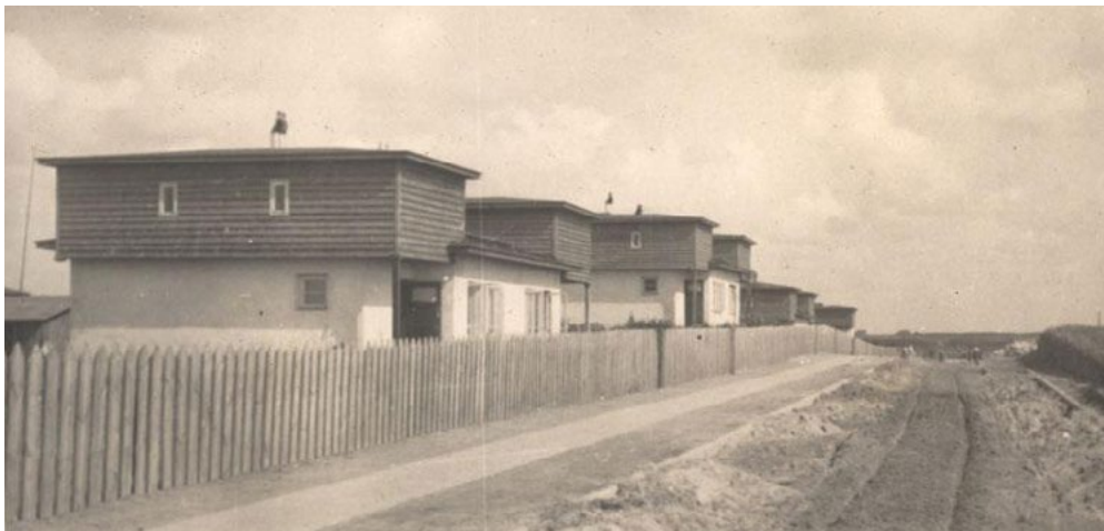
Ryc. 5. Kolonia Legionistów na Czechowie ul. Michała Wójtowicza, fotografia z lat 30-tych XX wieku, źródło: Zasób Ośrodka Brama Grodzka Teatr NN, Kolekcja Jolanty i Wojciecha Jurkiewiczów Fig. 5. The Colony of the Legionnaires in Czechów, Michał Wójtowicz Str. Photo from 30ties. of XX cent. Source: Zasób Ośrodka Brama Grodzka Teatr NN, the collection of Jolanta and Wojciech Jurkiewicz

Duże zainteresowanie wzbudzał wśród potencjalnych spółdzielców również teren Lemszczyzny 14 , leżący w bliskim sąsiedztwie centrum miasta. Zgodnie z Planem Wielkiego Miasta Lublina przeznaczony był on pod zabudowę mieszkaniową. Dobra lokalizacja w sąsiedztwie centrum miasta dawała możliwość szybkiej zabudowy oraz łatwego doprowadzenia mediów: wody, kanalizacji i elektryczności (po dokończeniu budowy ulicy Prusa).