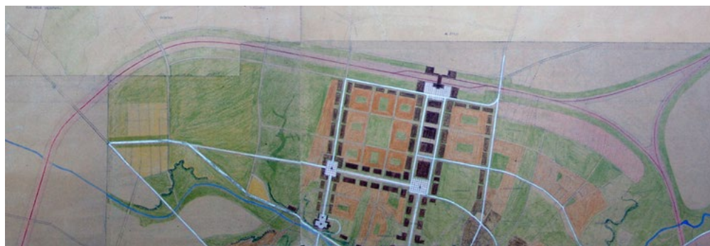
Ryc. 7. Lublin – ogólny plan zagospodarowania przestrzennego – wstępny. Dzielnica Północna. Podział terenów i komunikacja, zieleni, ośrodki mieszkaniowe, oraz wstępny podział strefowy, autorstwa T. Witkowskiego, 1950. Własność UM Lublin. Fig. 7. Lublin – the preliminary master plan. The Northern District. Land allocation, transportation, greenery, housing and general zoning, author T. Witkowski, 1950. Prioprety of UM Lublin.

W pierwszym ukończonym po II wojnie światowej ogólnym planie zagospodarowania przestrzennego Lublina opracowanym w 1954 roku można zauważyć dążenie do zgeometryzowania przyszłego układu urbanistycznego projektowanej dzielnicy, najprawdopodobniej wzorowany na planie z 1950 roku 19 . W planie nie pojawia się jednak obwodowa linia kolejowa. Główna oś komunikacyjna dzielnicy, której towarzyszyć miała zieleni stanowić miała przedłużenie ulicy Trzeciego Maja w kierunku północnym. Wzdłuż niej zaplanowano realizację zwartej, wyższej zabudowy o charakterze śródmiejskim o funkcjach mieszkaniowych