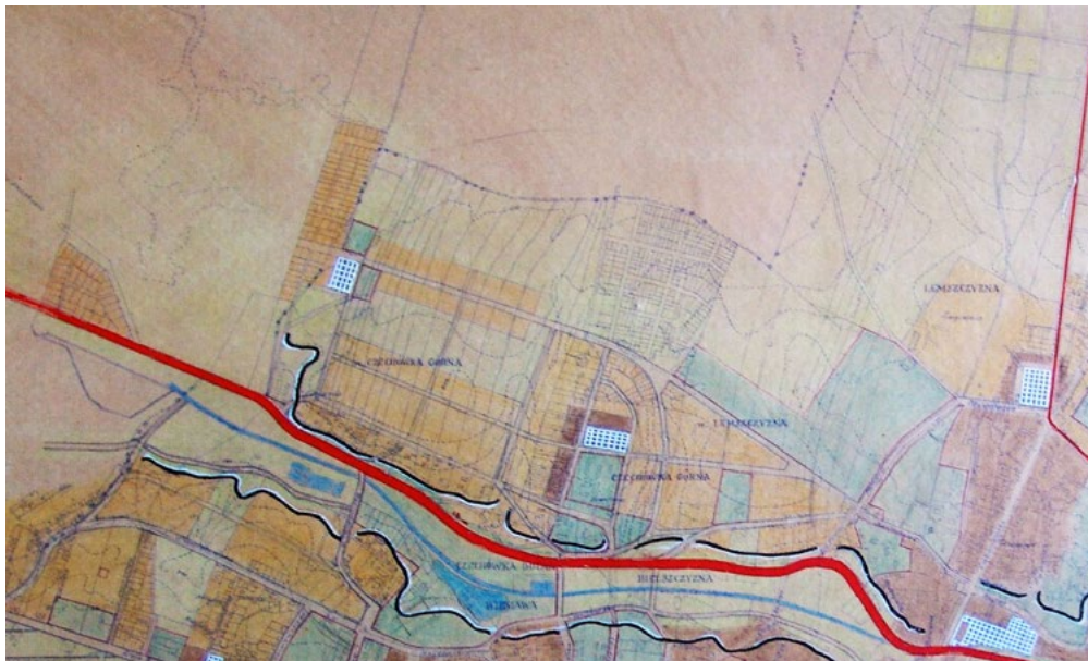
Ryc. 6. Lublin. Funkcjonalny Podział terenu – projekt. Fragment opracowania z 1948 roku. Własność UM Lublin. Fig. 6. Lublin. The functional division of the area. Fragment opracowania z 1948 roku. Prioprety of UM Lublin.