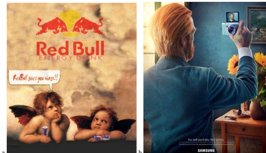
Ryc. 5. a. Plakat reklamowy Red Bull wykorzystujący obraz Michała Anioła; b. Plakat reklamowy firmy Samsung wykorzystujący dzieło Van Gogha Fig. 5 a. Advertising poster Red Bull using the image of Michelangelo; b. Advertising poster firmy Samsung uses the work of Van Gogh

W historii możemy znaleźć wiele przykładów, które pokazują, że reklama jedynie wykorzystuje sztukę do swych celów. Jako przykład możemy podać firmę Red Bull – obraz Michała Anioła czy Samsung – dzieło Van Gogha. Twórcy tych reklam chcąc przyciągnąć uwagę widza posłużyli się efektem niezgodności, po przez zestawienie ze sobą niepasujących elementów.