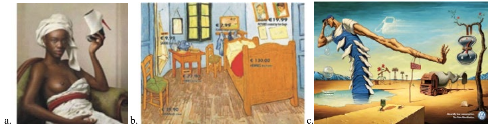
Ryc. 3 a. kampania Christiana Louboutina – Art of Renaissance ; b. Van Gogh reklama sieci sklepów Ikea; c. Surrealistyczny billboard dla Volkswagena Fig. 3 a. Campaign Christian Louboutin – Art of the Renaissance ; b. Van Gogh Ikea advertising network; c. Surrealistic advertisement for Volkswagen

Andy Warhol tworzył sztukę, która po przez dobór „zwykłych” produktów, stawała się reklamą posiadającą cechy dzieła sztuki. Wśród innych artystów, znajdziemy wiele przykładów gdzie dzieło sztuki zostaje wykorzystane w reklamie danego produktu. Zabieg ten ma na celu zwrócić na dany produkt uwagę, jednocześnie podkreślając jego wyjątkowość. Poza reklamami inspirowanymi pop-artem możemy znaleźć kampanie, których podstawą stały wielkie dzieła znanych artystów sprzed wielu lat. Art of Renaissance – Christiana Louboutina, słynne dzieło Van Gogha – reklama sieci sklepów Ikea czy Volkswagen.