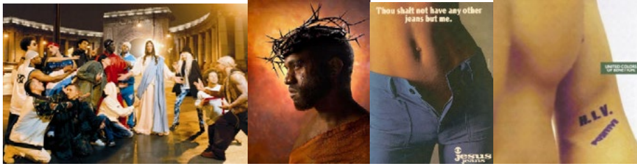
Ryc. 4. Przykłady plakatów reklamowych, które w niekonwencjonalny sposób promują znane produkty lub marki Fig. 4. Examples of advertisements which promote in an unconventional way product known or poppies

Styl zapoczątkowany przez Andy'ego Warhola, choć obecny w sztuce i kulturze od tak dawna, po dzień dzisiejszy wykorzystywany jest w reklamie. Popularne jest zwłaszcza korzystanie z kolorowych, kontrastowych portretów sławnych ludzi. Reklama, która wykorzystuje wizerunek znanej i poważanej osobistości w sposób niekonwencjonalny dziś już nikogo nie dziwi i nie szokuje, ale w czasach Warhola było czymś innowacyjnym. Takie przykłady wykorzystywania w dzisiejszej sztuce i reklamie stylu pop-art można mnożyć, ale styl ten wykorzystywany jest jednak nie tylko w reklamie, sztuce, ale również w projektowaniu ubrań, rzeczy codziennego użytku czy wystroju wnętrz. Wydaje się, że na dobre zagościł w naszej kulturze, co wcale nie dziwi, ponieważ jego przekaz jest dość prosty i zrozumiały dla przeciętnego odbiorcy. Zatem można stwierdzić, że reklama wykorzystuje sztukę do swych celów i mimo jej aspiracji do żadnej z dziedzin sztuki nie należy. Pasożytuje na dziełach wielkich artystów, budując dystans konsumentów. Zabiegi te mają na celu odwoływanie się do znanego autorytetu i uznanych wartości, wzbudzając w odbiorcy pozytywne emocje i skojarzenia. Sztuka staje się więc źródłem wielu wartościowych inspiracji do tworzenia oryginalnych reklam.