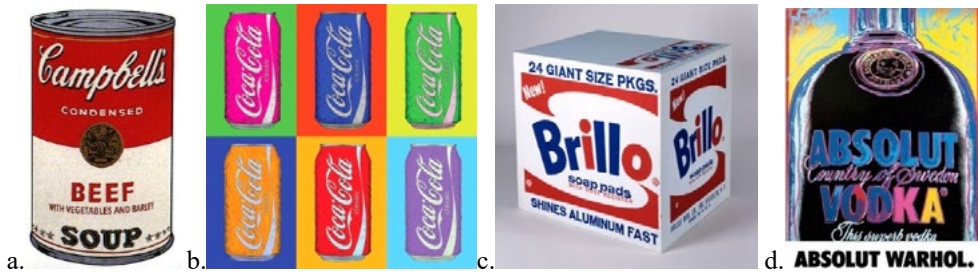
Ryc. 2 a. Puszka zupy Campbell's; b. Puszka Coca-Coli; c. Pudełko proszku Billo; d. Projekt dla marki Absolut – Andy Warhol