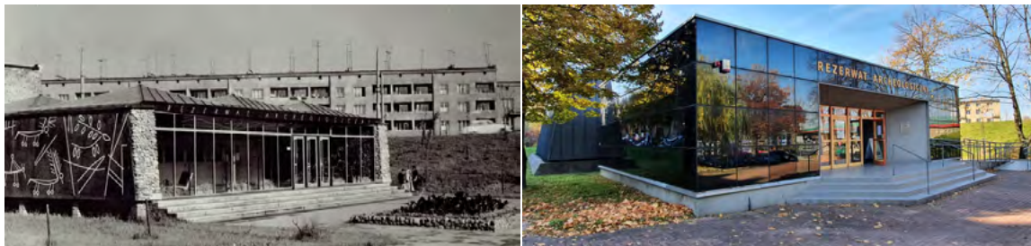
Ryc. 12. Pawilon Rezerwatu Archeologicznego w Częstochowie-Rakowie, stan pierwotny i stan obecny w 2021.

pawilon Rezerwatu Archeologicznego jest w mojej opinii przykładem braku poszanowania praw autorskich i tego jak nie należy przeprowadzać modernizacji tego typu obiektów.