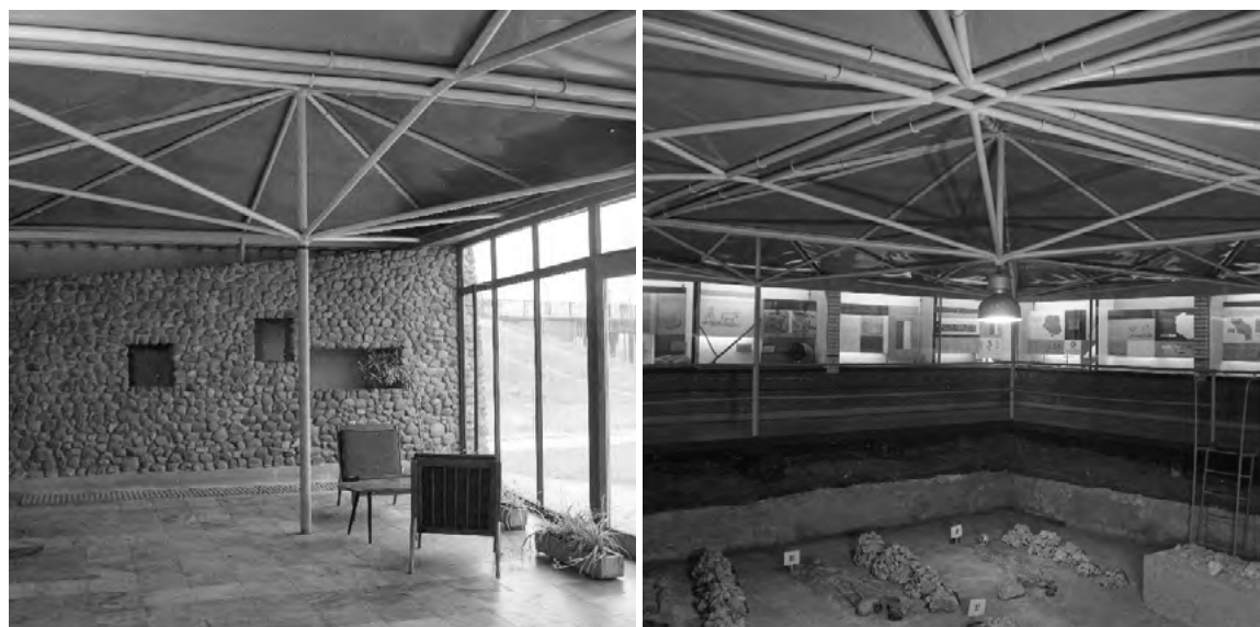
Ryc. 8. Wnętrze pawilonu Rezerwatu Archeologicznego w Częstochowie-Rakowie autorstwa Włodzimierza Ściegiennego, 1960 r.

Budynek wyróżniała opracowana przez autora mozaika z białych kostek ułożonych na czarnym tle, która inkrustowała dwie elewacje. Elementy kompozycji stanowiły przetransponowane elementy z wzorów ceramiki i przedmiotów kultury łużyckiej w Polsce: faksymile postaci ludzi, strzelca, jeźdźców na koniu, jeleni i znaków magicznych.