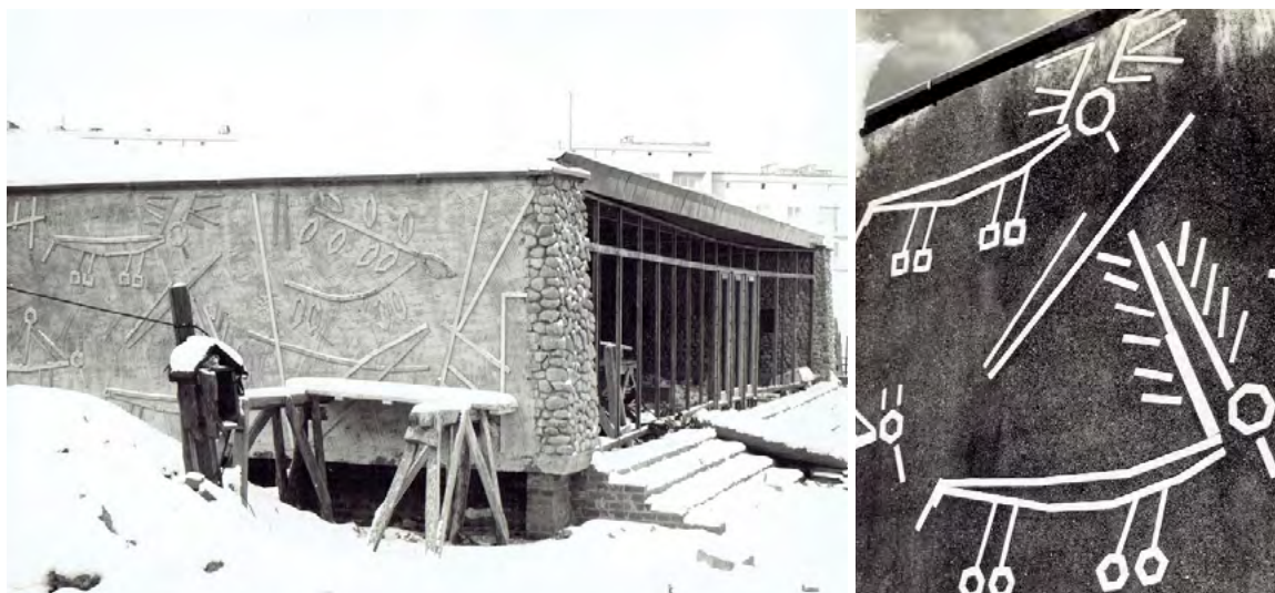
Ryc. 9. Mozaika na elewacji pawilonu Rezerwatu Archeologicznego w Częstochowie-Rakowie autorstwa Włodzimierza Ściegiennego, 1960 r.

Obecnie te motywy graficzne z nieistniejącej już mozaiki, są wykorzystywane przez Rezerwat Archeologiczny Muzeum Częstochowskie w identyfikacji wizualnej muzeum 15 .