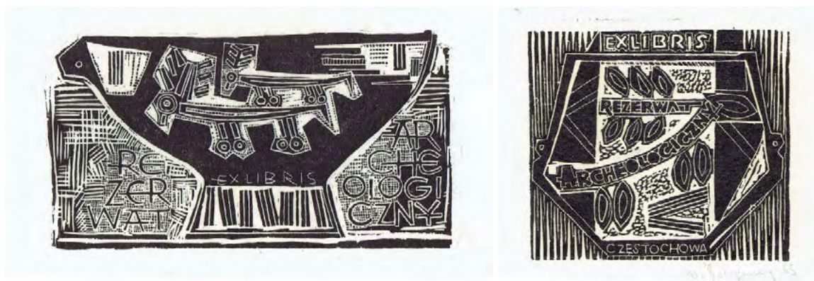
Ryc. 10. Wybrane Exlibrisy dla Rezerwatu Archeologicznego w Częstochowie-Rakowie autorstwa Włodzimierza Ściegiennego, 1960 r.

Opracowana w 1965 roku teka exlibrisów, specjalnie dla Rezerwatu archeologicznego, związana jest tematycznie z budynkiem rezerwatu, z zabytkami, pochówkami szkieletowymi odkrytymi na cmentarzysku, a także ze zdobieniami ceramiki kultury łużyckiej.