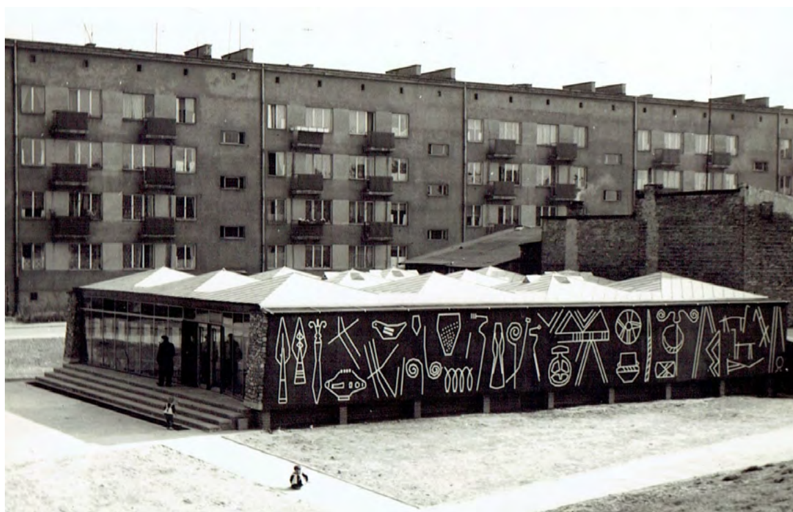
Ryc. 7. Pawilon Rezerwatu Archeologicznego w Częstochowie-Rakowie autorstwa Włodzimierza Ściegiennego, 1960 r.