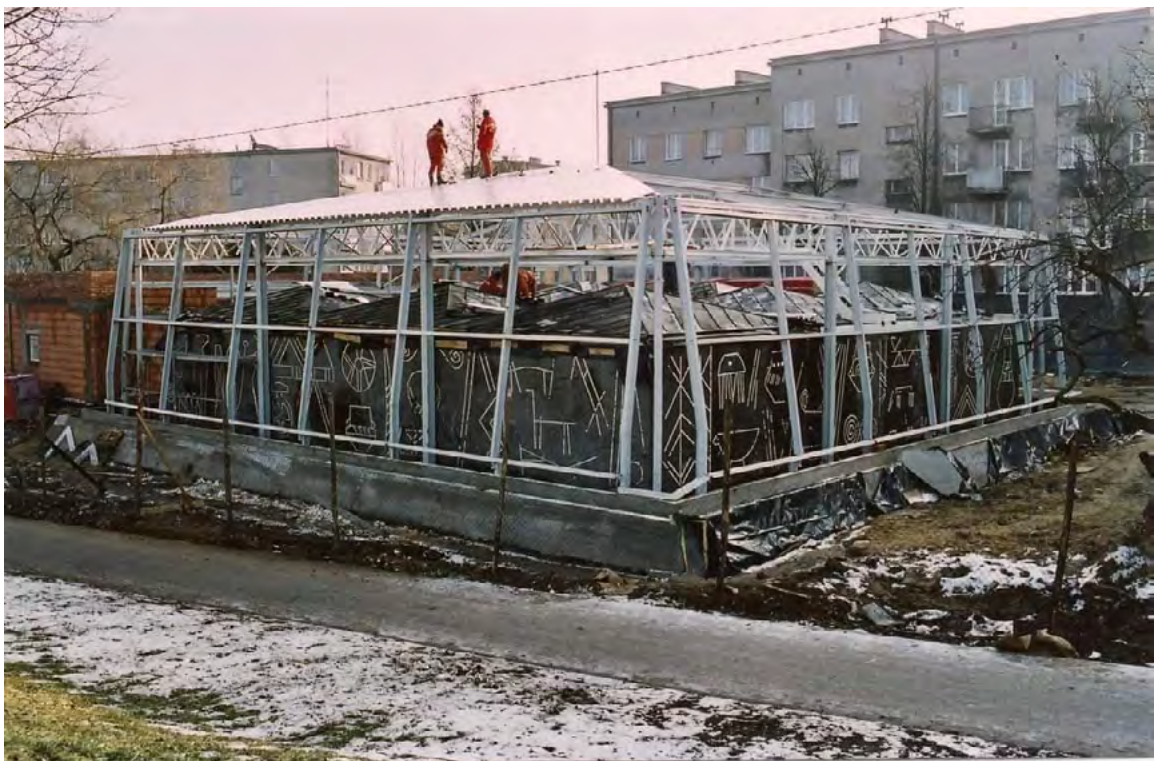
Ryc. 11. Przebudowa pawilonu Rezerwatu Archeologicznego w Częstochowie-Rakowie

Koncepcja na nową formę pawilonu bezpowrotnie zniszczyła unikatowy obiekt, poprzez nałożenie na niego stalowej konstrukcji, która nie tylko całkowicie zakryła i zniszczyła charakterystyczną mozaikę ale zmieniła całkowicie proporcje i wygląd budynku.