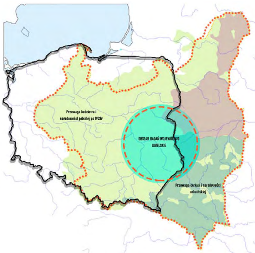
Ryc. 1. Mapa terytorialna.