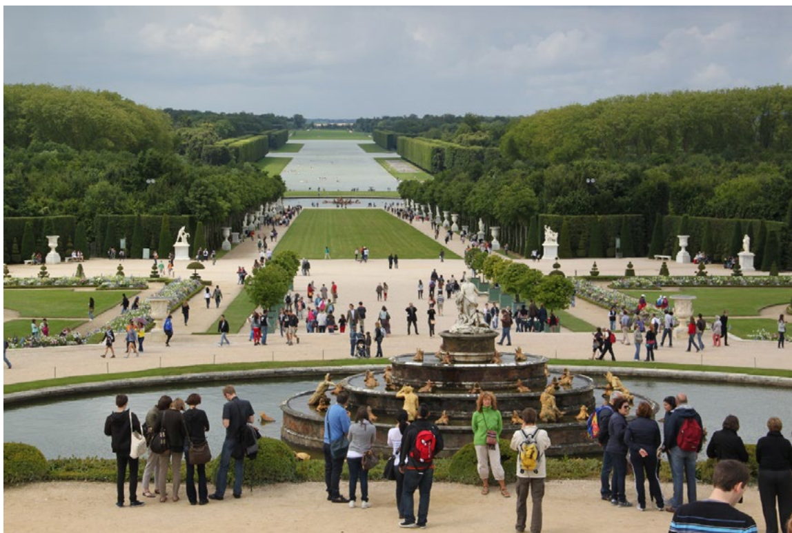
Ryc. 1. Wersal, widok na wielką oś. W tle rampa ogrodowa projektu Le Notra, (2012)

Zarówno budynki jak i przestrzeń projektowana powinny więc być dostępne dla wszystkich. Problem pojawia się, kiedy mamy do czynienia z substancją zabytkową. Niektóre obiekty lub przestrzenie ze względu na swoją specyfikę (uwarunkowania prawne czy kontekst historyczny) są tego pozbawione, a ich dostosowanie bywa po prostu niemożliwe. Podobnie ma się rzecz w odniesieniu do przestrzeni historycznych parków towarzyszącym założeniom rezydencjonalnym. Podjęcie próby tworzenia większej dostępności historycznych terenów zieleni pojawia się podczas projektów rewaloryzacyjnych, które dają projektantom możliwość dostosowania ich przestrzeni do potrzeb wszystkich użytkowników.