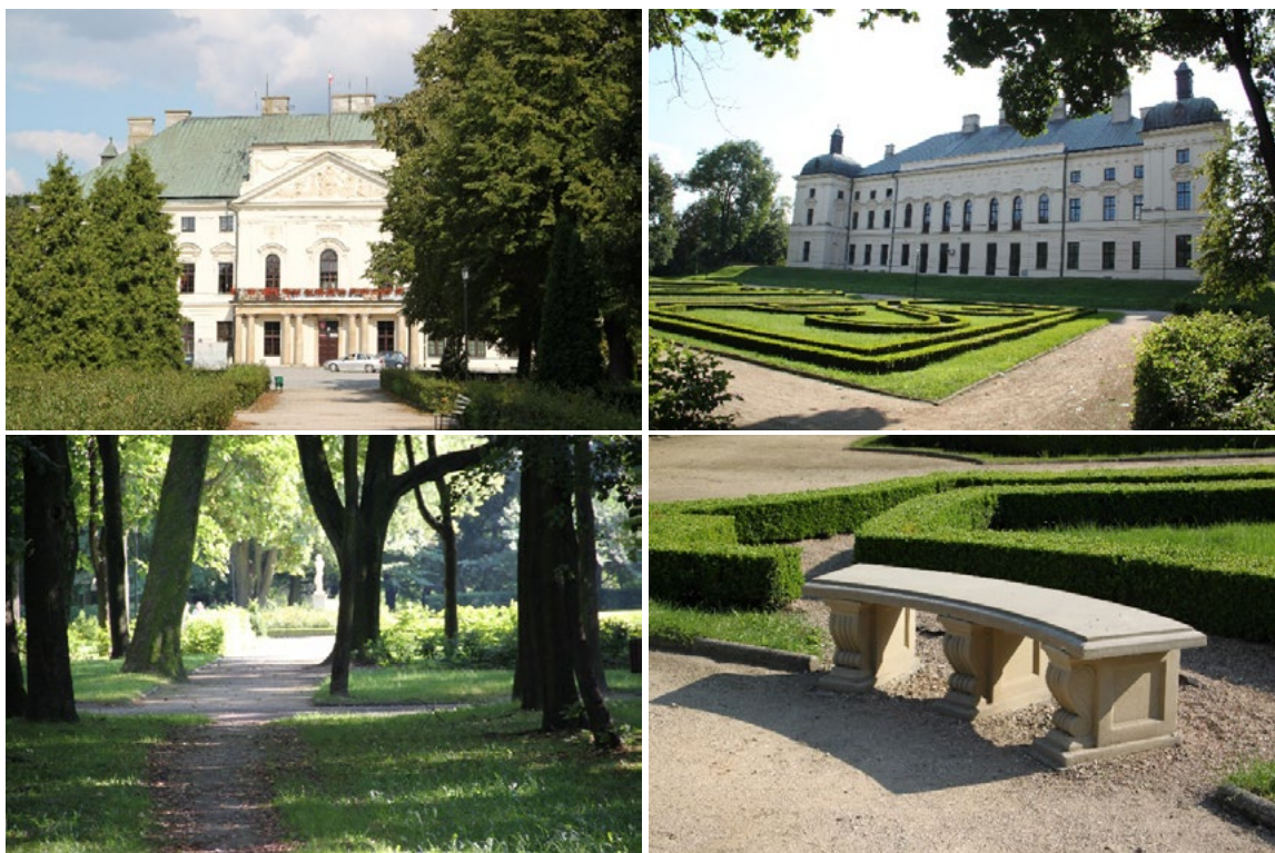
Ryc. 6. Zespół pałacowo-parkowy w Lubartowie, pałac, nawierzchnie i elementy małej architektury 2012, fot. autor Palace-park complex in Lubartów, palace, pavements and objects of small architecture 2012 photo by author

Z pałacem w Lubartowie nierozdzielnie związane jest założenie pałacowo-parkowe w Kozłowie. Oba zespoły połączone zostały ze sobą za pomocą alei lipowej.