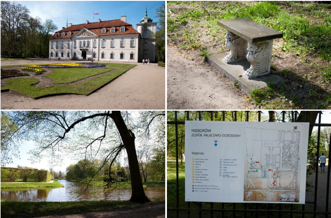
Ryc. 5. Zespół pałacowo-parkowy w Nieborowie, pałac oraz elementy małej architektury 2012, fot. autor Palace – park complex in Nieborów, palace and objects of small architecture 2012, photo by author

Zespół pałacowo-parkowy w Nieborowie był własnością rodziny Radziwiłłów. Założenie ogrodowe posiada charakter barokowego układu regularnego. Ostateczną jego formę ukształtował w XVIII wieku Szymon Bogumił Zug. Obecnie budynek pałacu pełni rolę muzeum, zaś park udostępniony jest zwiedzającym. Przestrzeń parku została wygradzona. Ogród nie posiada identyfikacji wizualnej ani ścieżek dla osób niewidomych lub słabo widzących. Plan barokowego parku został jedynie wyeksponowany na ogrodzeniu, jednak nie jest on dostosowany do potrzeb wszystkich użytkowników. W parku brakuje także oświetlenia. W przeważającej części ogrodu zastosowano nawierzchnie mineralne i zwykłe drogi gruntowe (Ryc. 5).