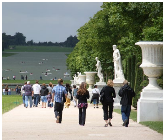
Ryc. 2b. Utwardzona nawierzchnia mineralna wzdłuż głównej osi w Wersalu, (2012)

“Mini train” in Versailles