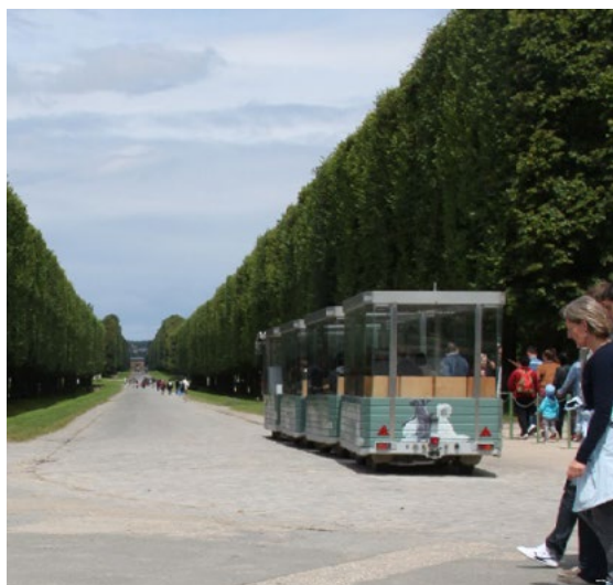
Ryc. 2a. „Mini pociąg” w Wersalu

Tam gdzie to konieczne – w pałacu i parku pojawił się system ramp i wind umożliwiających komunikację – omijając schody.