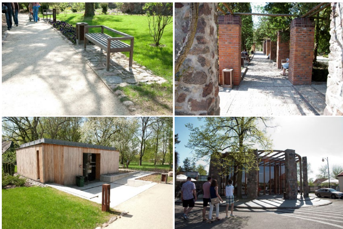
Ryc. 3. Zespół dworsko-parkowy w Żelazowej Woli, zróżnicowane nawierzchnie oraz nowoprojektowane pawilony, 2012

W przestrzeni parku pojawił się także wolno stojący drewniany pawilon. Mieści on sanitariaty dostosowane do potrzeb osób niepełnosprawnych. Obiekt umiejscowiony w niewielkim obniżeniu został skomunikowany z głównym ciągiem pieszym za pomocą schodów i ramp o małym procentowym spadku (Ryc. 3)