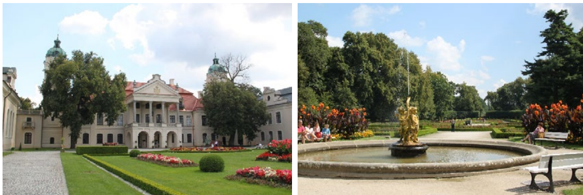
Ryc. 7. Zespół pałacowo-parkowy w Kozłóвке, pałac oraz część ogrodowa 2012 Palace-park complex in Kozłówka, palace and garden behind the building 2012

Innym przykładem jest zespół dworsko-parkowy w Romanowie mieszczący Muzeum im. Józefa Ignacego Kraszewskiego. Park wraz ze dworem dostępny jest dla wszystkich zwiedzających. Do dworu, wyniesionego nieco do poziomu gazonu, od strony frontowej prowadzą dwie rampy wkomponowane w podjazd.