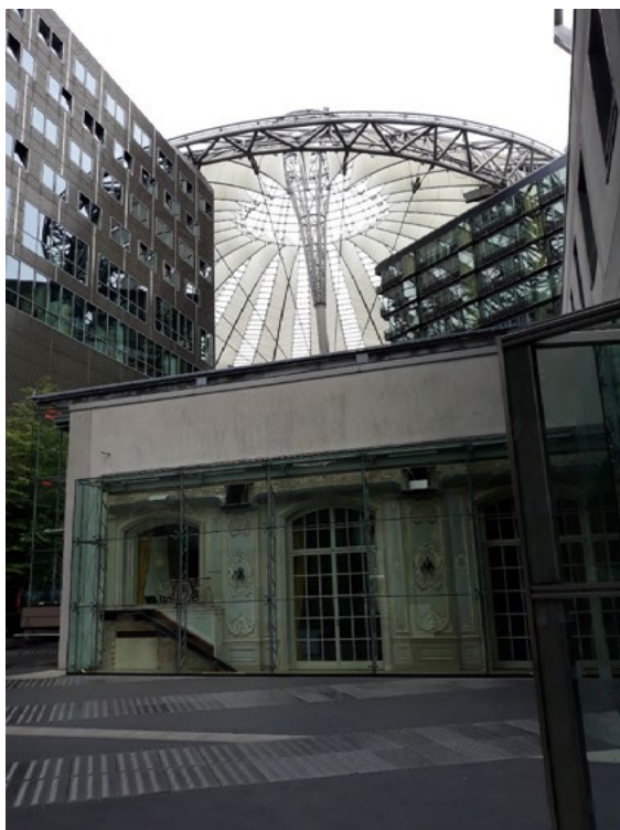
Ryc. 1. Hotel Esplanade – fragmentu ściany hotelu. W tle „parasol” Sony Center.