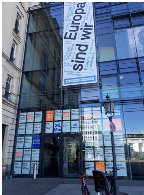
Ryc. 2. Wejście do Akademii Sztuki w roku 2019 przed wyborami do Parlamentu Europejskiego.

Wrażenia wejścia w klimat minionej epoki są wzmacniane wieczorem, kiedy kolorowa gra świateł dodatkowo wydobywa detale i nastroja emocjonalnie do zanurzenia się i poznania przeszłej specyfiki tego miejsca. Fragment muru Sali Cesarskiej stymuluje poznawczo, zachęca do poznania i odrobienia lekcji z przeszłości związanej z tym miejscem. Kolejny aspekt to zaspokajanie potrzeby bycia w miejscu jedynym, unikatowym i zarazem historycznie doświadczanym. Przeprowadzone i opisane wyżej założenie architektoniczne wyzwała psychologiczne poczucie uczestniczenia w ciągłości kultury oraz sprzyja budowaniu tożsamości mieszkańców. Dla świadomych turystów i przyjezdnych czy bywalców w tej przestrzeni, rozszerza horyzonty poznawcze i uruchamia sieć powiązań europejskich. Pozwala kształtować świadomość, że uczestniczenie w kulturze nie jest oddzielane granicami czy przynależnościami narodowymi. Jako inny przykład budowania powiązań europejskich i tworzenia wspólnoty wykraczającej poza ściśle lokalne uwarunkowania można wskazać wystrój frontonu Akademii Sztuki w Berlinie przed wyborami do Parlamentu Europejskiego w 2019 r. Wyartykułowane tam hasło przewodnie brzmi: „Europa to my” i jest wypisane w językach wszystkich krajów tworzących Unię Europejską (Ryc. 2).