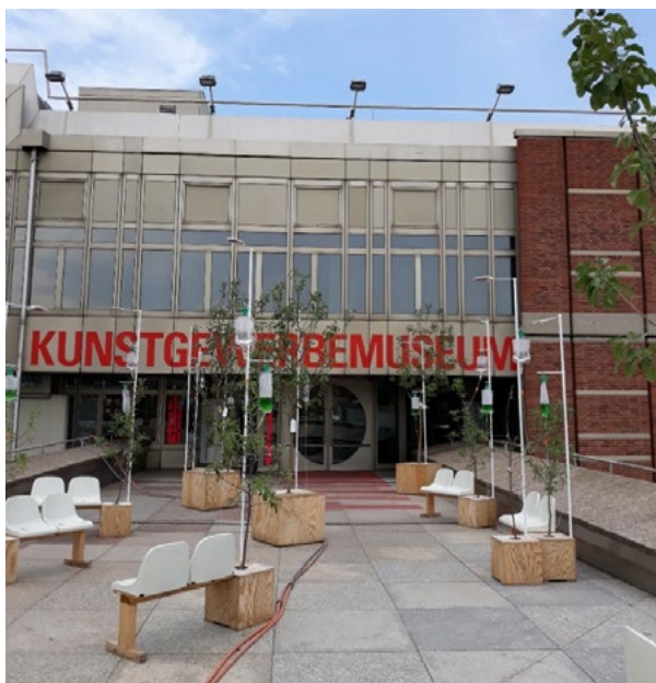
Ryc. 5. Roślinny z podłączonymi „kropiówkami” (2018 rok).

Słowo muzeum tradycyjnie kojarzy się z ekspozycją wyrobów materialnych z przeszłości. Na obszarze Kulturforum, w przestrzeni pomiędzy budynkami tworzone są okresowe prezentacje współczesnych problemów m.in. ekologicznych. 1 (Ryc. 5).