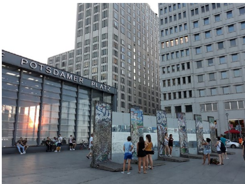
Ryc. 6. Fragment Muru Berlińskiego wyeksponowany przy wejściu do Sony Center.

Wspomniany wyżej Mur Berliński jako betonowa zaporą, o długości 156 km trwał przez 28 lat i przegradzał miasto na dwie części: Berlin Zachodni i Wschodni. Wzniesiony w 1961 roku, w szczególnej sytuacji politycznego podziału Europy na dwa wrogie bloki stał się symbolem dramatu zarówno pojedynczych ludzi (oddzielenia rodzin czy śmierci dla zdesperowanych pragnących przedostać się do Berlina Zachodniego) jak i podziału zbiorowości. Mur był granicą, której przekroczenie wymagało pozwoleń i wiz. Jesień, roku 1989 była świadkiem historycznych wydarzeń. Demokratyczne przemiany w Polsce i masowe demonstracje w Niemczech Wschodnich przyczyniły się do ogłoszenia przez rząd NRD możliwości przekraczania granicy tylko na podstawie dowodu. Ta informacja wywołała coraz większe zgromadzenie ludzi przy przejściach. Tłum stawał się coraz większy. Służby graniczne zdecydowały się przepuszczać ludzi bez sprawdzania dokumentów. W krótkim czasie coraz więcej przejść było otwieranych a następnie mieszkańcy przystąpili do niszczenia muru. W 1990 roku wprowadzono unię walutową i rozpoczął się fizyczny demontaż muru. Pozostawiono kilka fragmentów jako pomniki pamięci. Fragment muru znajduje się również przy wejściu do Potsdamer Platz (Ryc. 6).