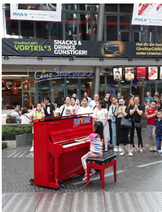
Ryc. 4. Popisy małych i odważnych „artystów” z Azji.

Instrument muzyczny pełni co najmniej dwie funkcje. Pozwala w sposób bierny, poprzez słuchanie, uczestniczyć w muzycznych popisach mniej lub bardziej biegłych artystów ale również jest okazją do aktywnego uczestnictwa w życiu społecznym toczącym się w obrębie placu. Podkreślenia swojego znaczenia poprzez wyjście z tłumu (beżimiennej zbiorowości) i zaprezentowanie siebie, poprzez grę na pianinie. W obrębie Sony Center funkcjonują również liczne sklepy, kompleks kin oraz w tym miejscu organizowane są wydarzenia artystyczne, kulturalne, rozrywkowe i rekreacyjne np. okresowe lodowisko działające w sezonie zimowym.