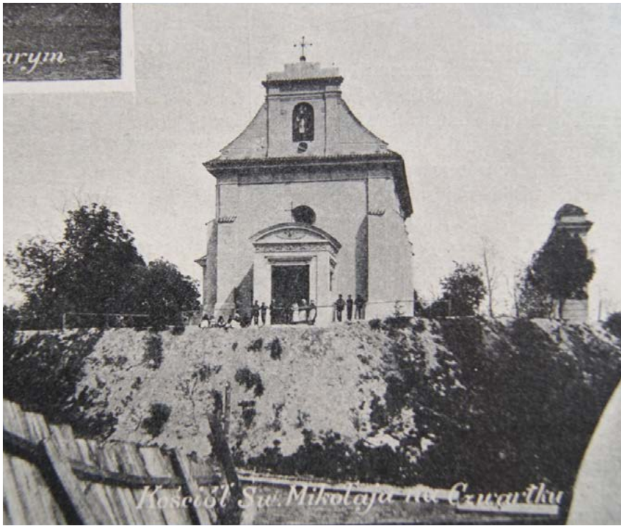
Ryc. 7. Fasada kościoła, TI 1912 nr 14