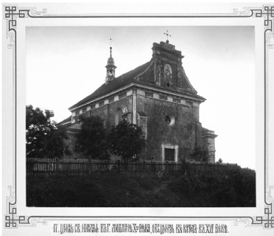
Ryc. 6. Pocztaówka przedstawiająca kościół św. Mikołaja pod koniec XIX-tego wieku

Fragment of painting “Wjazd gen. Zajączka do Lublina” 1826