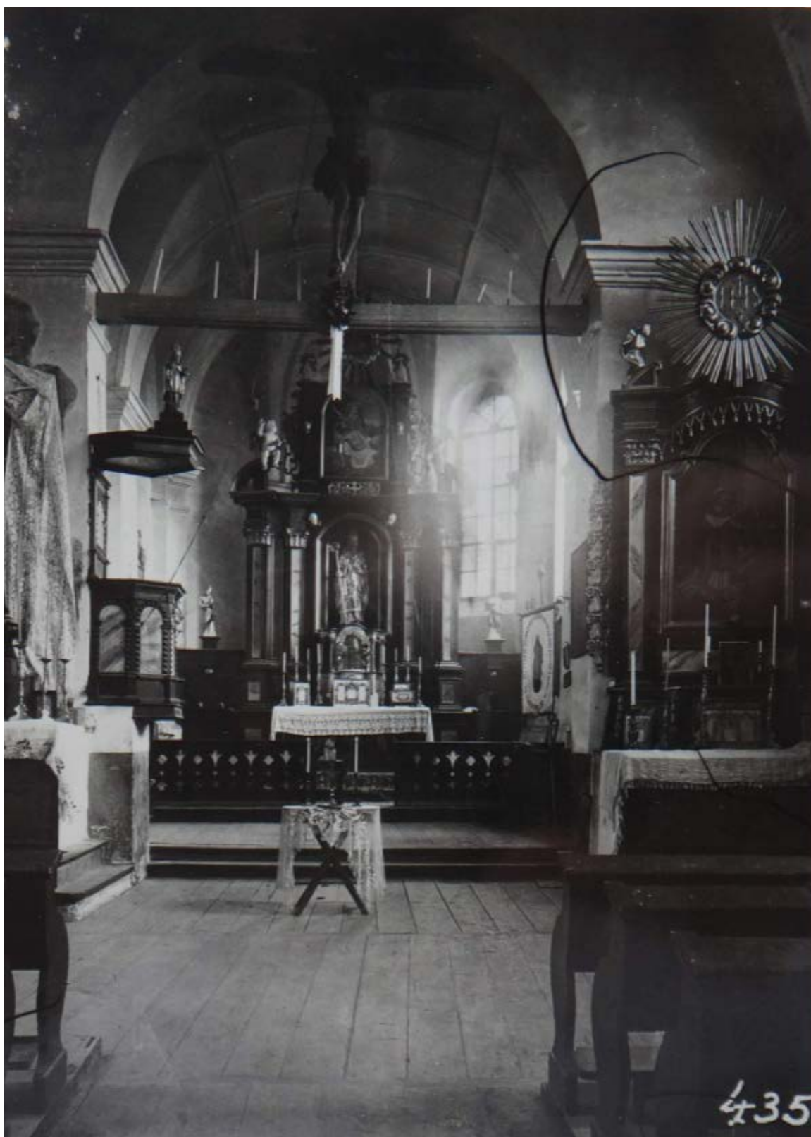
Ryc. 9. Wnętrze kościoła z widokiem na prezbiterium, początek XX-tego wieku, Archiwum LWKZ, 8940P View on presbytery, beginning of the XX c