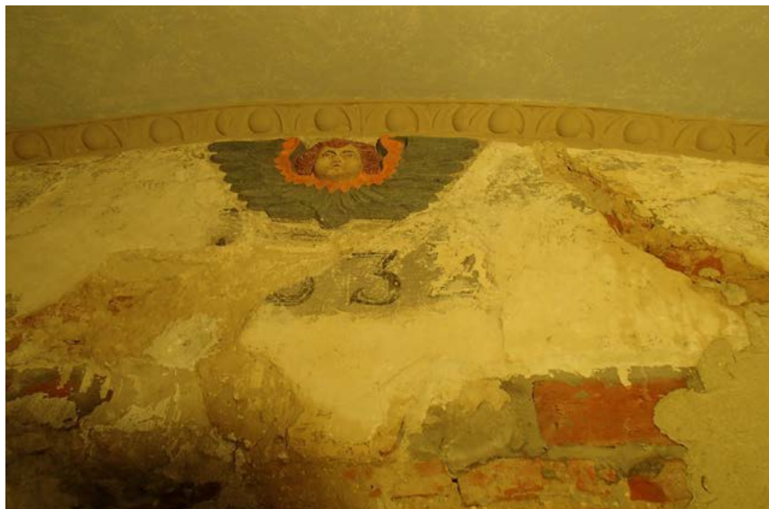
Ryc. 1. Fragment daty na ścianie tęczy odsłonięty w trakcie prac konserwatorskich w 2013 r.