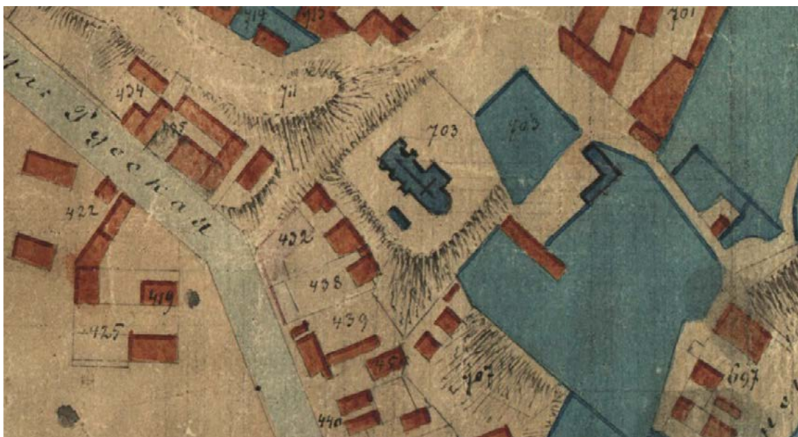
Ryc. 2. Fragment planu miasta Lublina z 1870 r. APL, PmL, sygn. 5

Od 2006 r. do chwili obecnej trwają prace remontowe w nawie i prezbiterium mające na celu uwidocznienie renesansowego wystroju wnętrza kościoła. Odkryto między innymi liczne renesansowe polichromie, które poddano konserwacji z przeznaczeniem do ekspozycji, a w części zrekonstruowano. Wzmocniono sklepienia nad prezbiterium. Nad tęczą odsłonięto fragment daty wskazującej na czas zakończenia remontu. Prace we wnętrzu cały czas trwają.