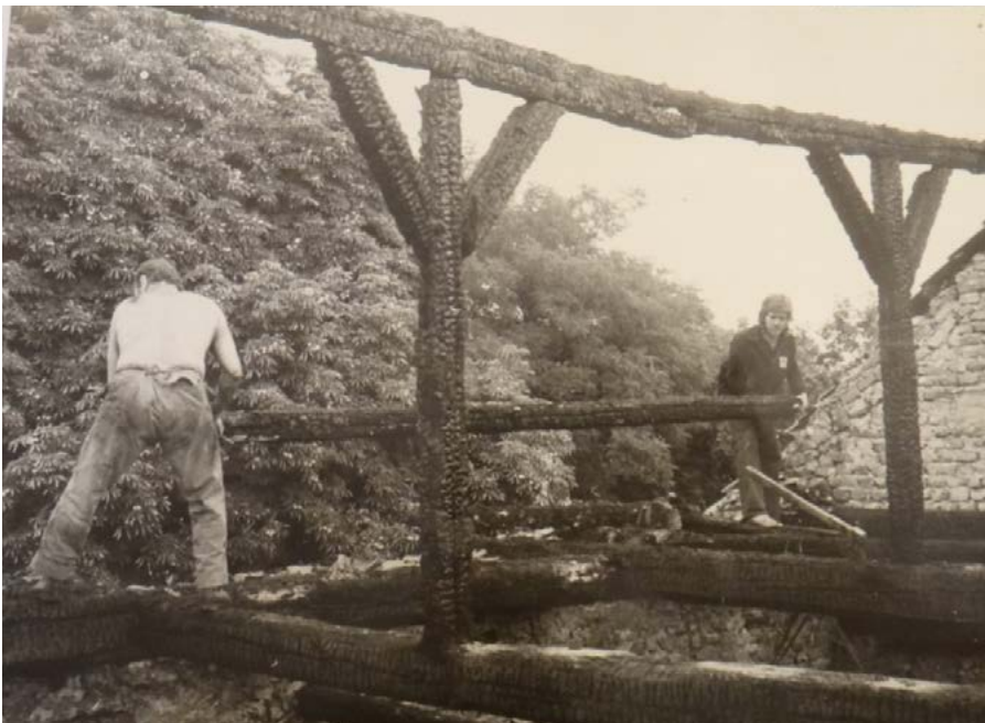
Ryc. 8. Więźba dachowa po pożarze z 1976 r. w trakcie porządkowania

Roof after fire from 1976, in track arrangement,