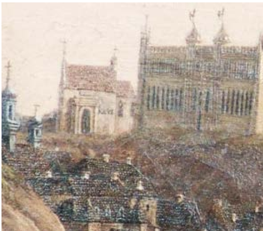
Ryc. 5. Fragment obrazu „Wjazd gen. Zajączka do Lublina” z 1826 r.

Fragment of painting “Wjazd gen. Zajączka do Lublina” 1826