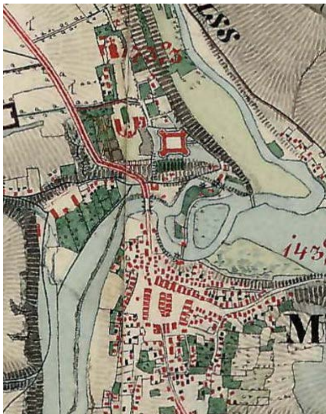
Ryc. 1. Mikulińce. Mapa historyczna (1806 – 1869 r.). Fragment [8].

Miasteczko Mikulińce powstało na bardzo malowniczych terenach Podola. Przyczyniła się do tego bliskość rzeki Siret i sąsiednich wzgórz, kiedyś ukrytych w lasach (Rys. 1). W pobliżu Mikulińce przechodziła jedna z głównych dróg tatarskich. Dlatego nie jest dziwne, że na północ od wsi na przylądku, otoczonym półkolem rzeki, w połowie XVI wieku Anna z Siniawskich, żona W.S. Jordana, kasztelana krakowskiego, wybudowała zamek warowny [1, s. 116]. To dzięki Annie Sinjawskiej Mikulińce w 1595 roku, zgodnie z przywilejem króla Zygmunta III otrzymały status miasta, i to przyczyniło się do jego aktywnego rozwoju społecznego i gospodarczego.