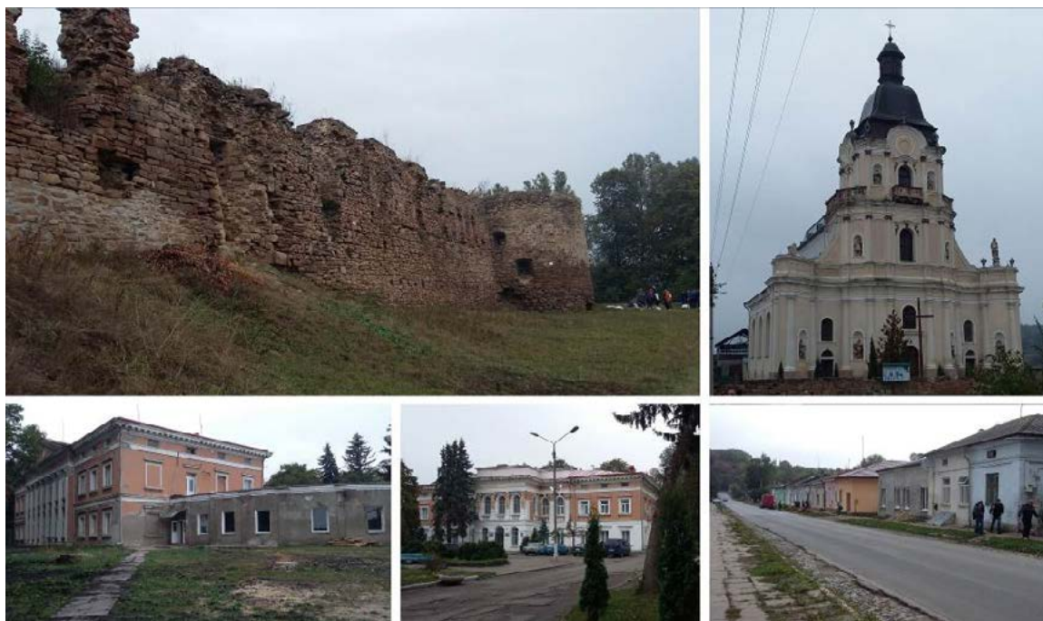
Ryc. 2. Mikulińce. Historyczna zabudowa (2015).

Niestety, balneologiczny szpital Konopki nie wytrzymał konkurencji z uzdrowiskami europejskimi i z uzdrowiskiem w Truskawcu, więc sanatorium później został zamknięty. Pałac był zwykłą siedzibą Konopok, którzy byli jej właścicielami przed II wojną światową. W czasach sowieckich, w pałacie znajdował się Obwodowy Mykulynecki Szpital Fizjoterapeutyczny, jest on tam do dziś.